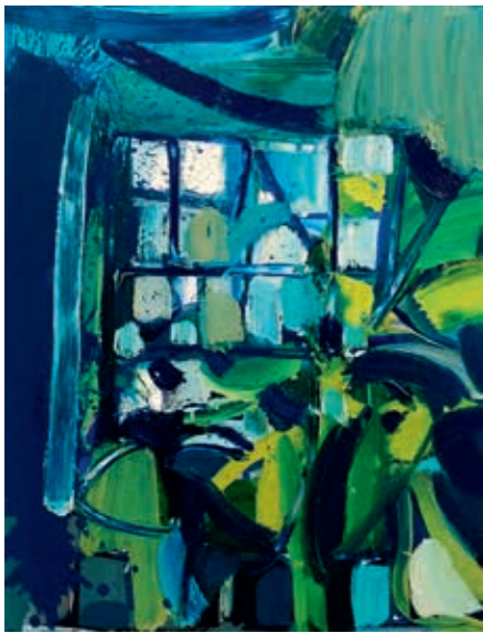
Ausma Bankauskaitė, „Atspindžiai“, 2023 m., 80 x 60, aliejus, drobė