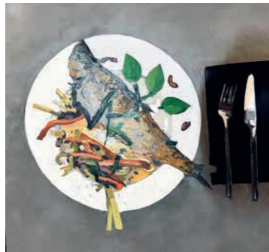
Peeter Krosmann, „Grill forell“, 2021 m., 70 x 90, aliejus, drobė