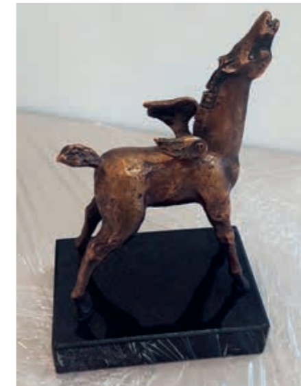
Sergejus Plotnikovas, skulptūrėlė „Pegasas“, 2023 m., 23 x 15, akmuo, bronzos