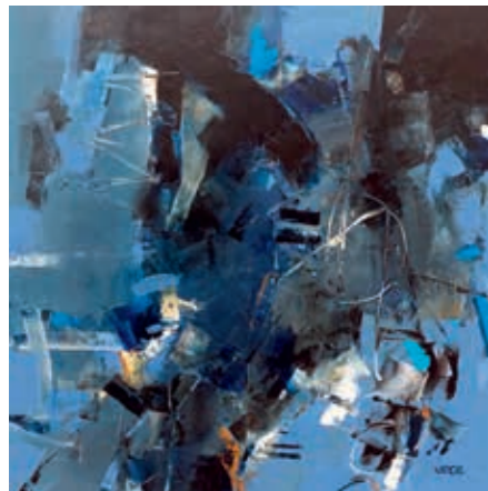
Virgis Tamošiūnas, „Anarchija danguje“, 2018 m., 80 x 80, aliejus, drobė