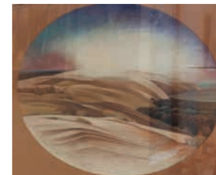
Aurimas Anusas, „Pilkosios kopos. Rūkas“, 2023 m., 70 x 90, spalvoti pieštukai, popierius