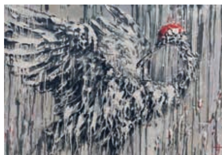
Iveta Antanaušienė, „Ryto rasos“, 2019 m., 70 x 100, akrilas, drobė