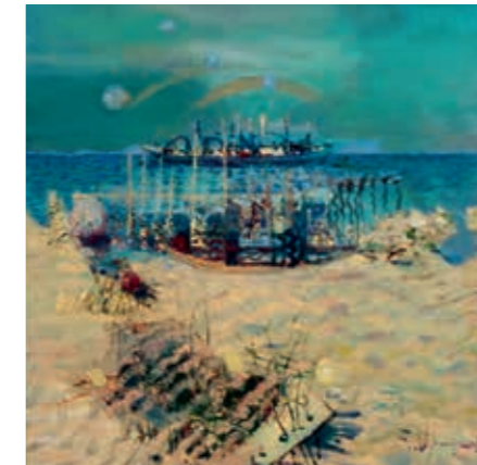
Gražina Vitartaitė, „Šventosios uostas“, 2014 m., 80 x 80, aliejus, drobė