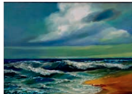
Edvardas Malinauskas, „Jūra motulė“, 2022 m., 40 x 55, aliejus, drobė