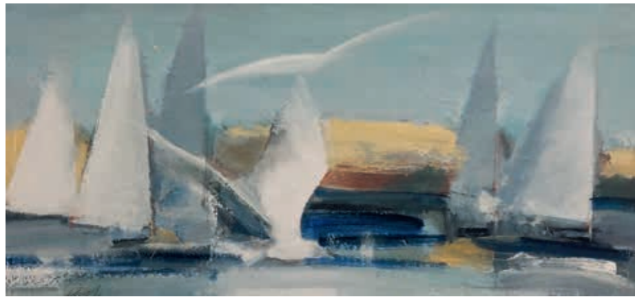
Gintaras Pankevičius, „Regata“, 2023 m., 50 x 100, akrilas, drobė