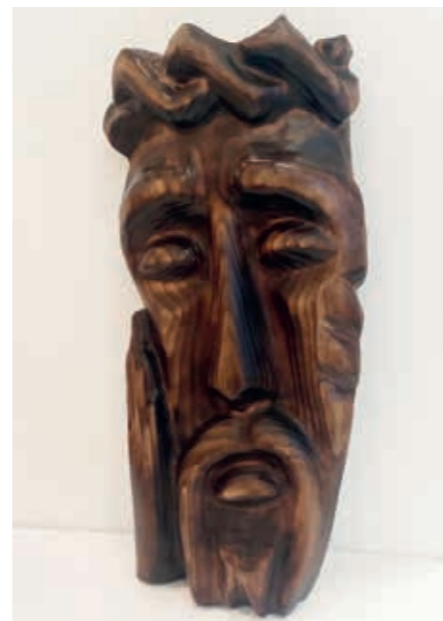
Linas Žulkus, medžio drožinys „Ramybė“