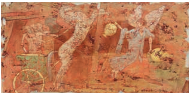
Alfredas Jurevičius, „Angelas su eliksiuru“, 2003 m., 60 x 120, aliejus, kartonas