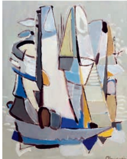
Antanas Obcarskas, „Baltos burės“, 2022 m., 100 x 81, aliejus, drobė