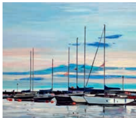
Arvydas Kašauskas, „Nida“, 2021 m., 90 x 100, aliejus, drobė