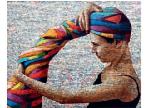
Alfredas Jurevičius, „Po maudynių“, 2023 m., 80 x 100, aliejus, drobė