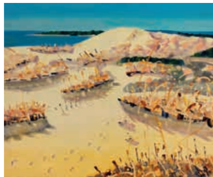
Vytautas Poška, „Kopos“, 2022 m., 80 x 100, aliejus, drobė