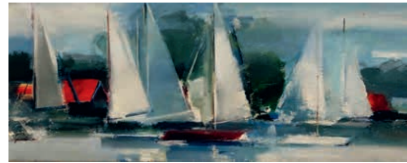
Gintaras Pankevičius, „Šventė Nidoje“, 2023 m., 40 x 100, akrilas, drobė