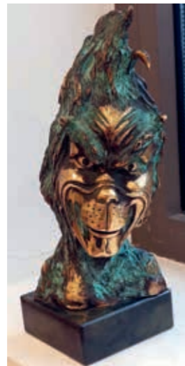
Svajūnas Jurkus, skulptūrėlė „Grinčas“, 2023 m., 23 x 15, akmuo, bronzos