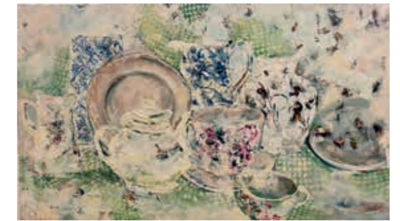
Dalia Skridailaitė, „Vitrina“, 2021 m., 65 x 110, aliejus, drobė